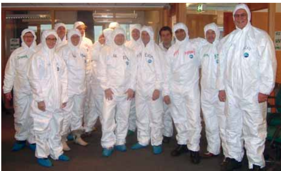
Ut på seminar i "månedress". Det var alt de ansatte visste og spenningen var stor før avreise